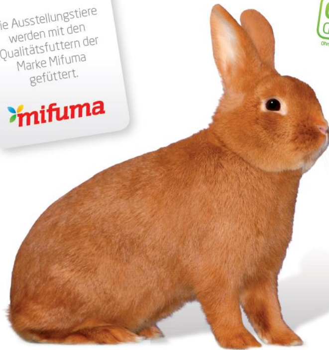
Rasse des Jahres 2017: Sachsgold

OHNE GENTECHNIK Ohne Gentechnik-Kennzeichnungspflicht